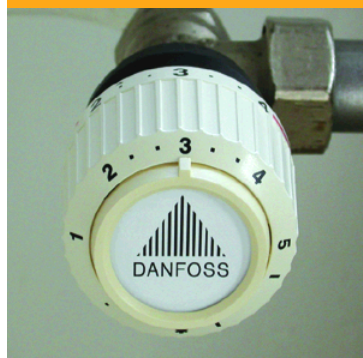
Thermostat richtig einstellen