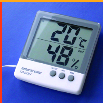
Ideale Raumtemperatur 20°C